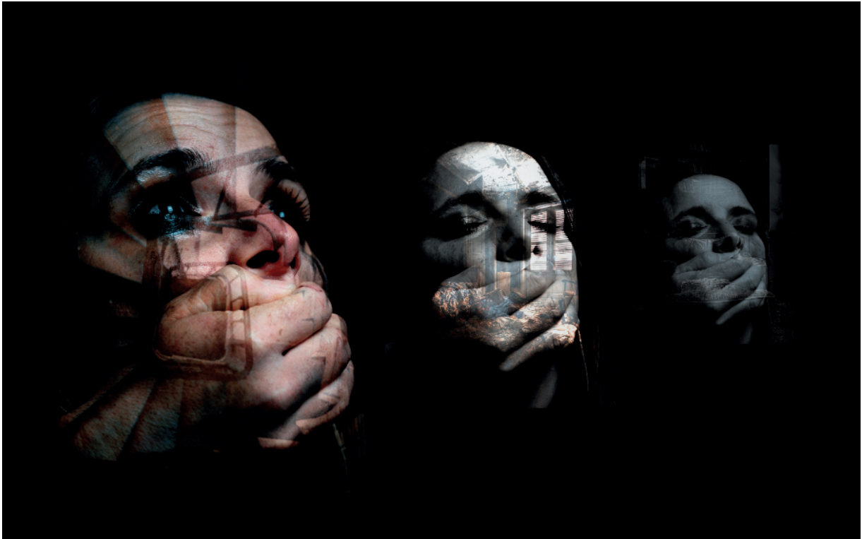
"Dans ma tête" ©Kevin Viganne